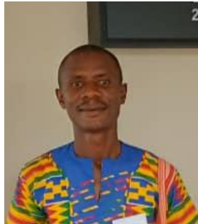
Mambu Sierra Leone

If you want to learn more or join Please reach out to us by email at: milan@mclid.org