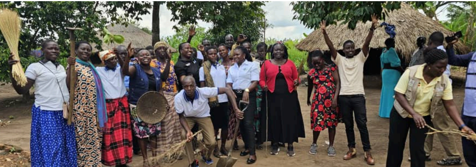
Miembros de MDLC Uganda en la celebración por el décimo aniversario del MDLC, en mayo de 2025. Región norte de Uganda.

Creemos firmemente que un futuro justo, pacífico y sostenible solo puede lograrse a través de comunidades inclusivas y autosostenibles que trabajan juntas para hacer realidad sus propias visiones de futuro.